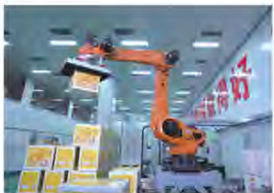
好想你智能化车间生产线