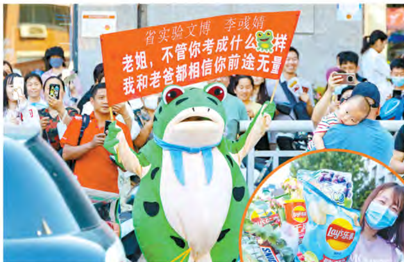
家人打扮成网红“卖崽青蛙”迎接考生